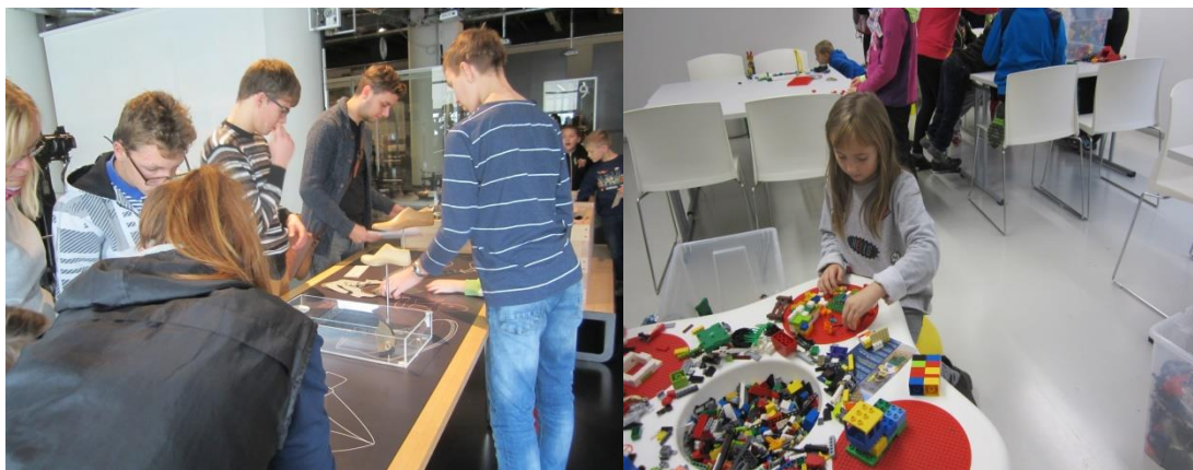
V muzeu jak se vyráběla obuv

Závěr: i když se děti těšily na farmu a projížďku na koních, tak velmi ochotně se podřídily a přijaly náhradní variantu. Děti na závěr samy navrhovaly program dalšího výletu a mnohým se nechtělo jít domů...nejraději by zůstaly se svými dobrovolníky do dlouhých večerních hodin.