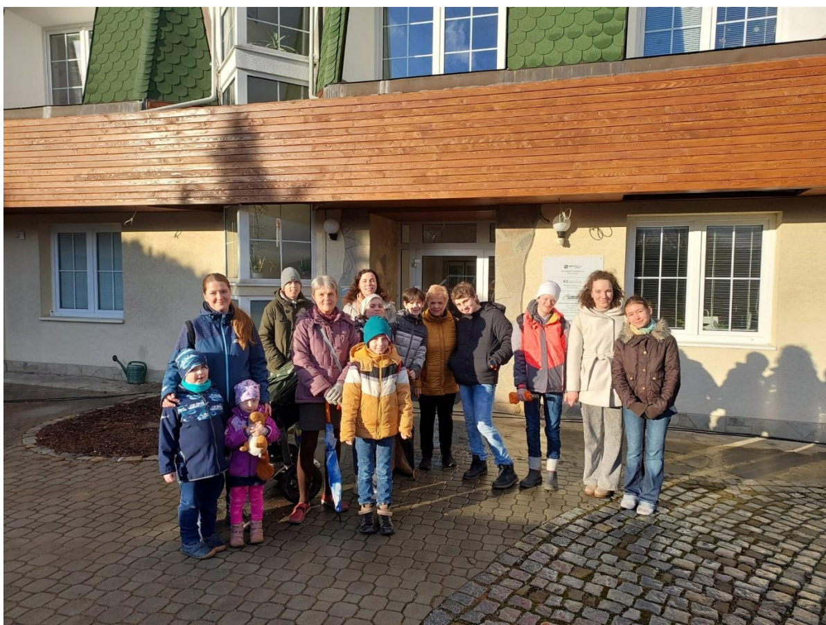
Společná akce – exkurze Hitrádio Zlín