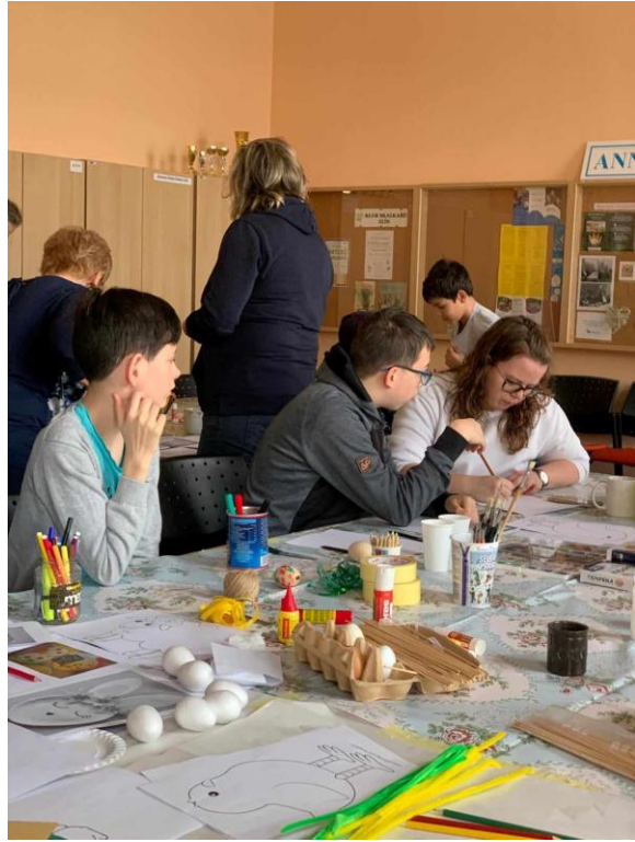
Velikonoční akce a celodenní výlet na kozí farmu