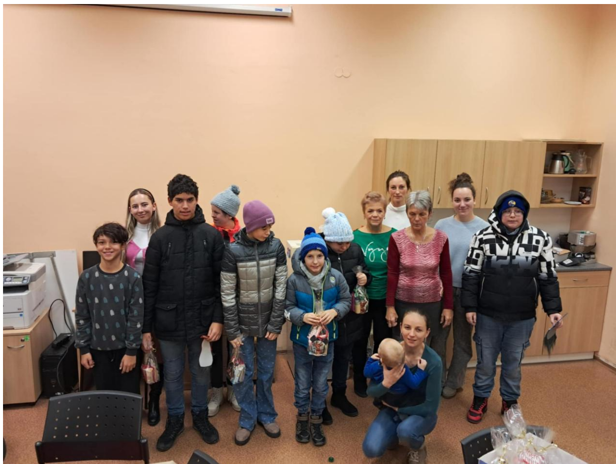
Přednáška na UTB v únoru 2024, Zlínské jaro, Dny Dobrovolnictví,...